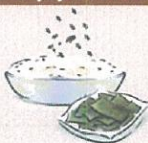
Sprinkle on fried rice or fried noodle